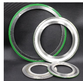
セミメタリックガスケット