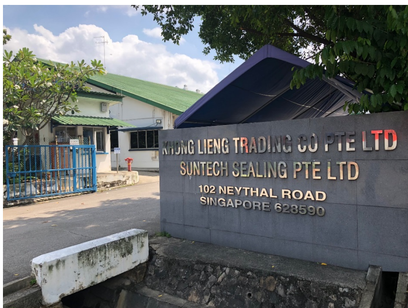
Khong Lieng Trading Company Pte Ltdの外観

KLTグループは、ガスケット製品（パイプや配管の継ぎ目に使用し、内容物の漏れや異物混入を防ぐための固定用シール）を輸入し、シンガポールを中心とした東南アジア各国の製油所、工場、船舶などに加工販売しております。