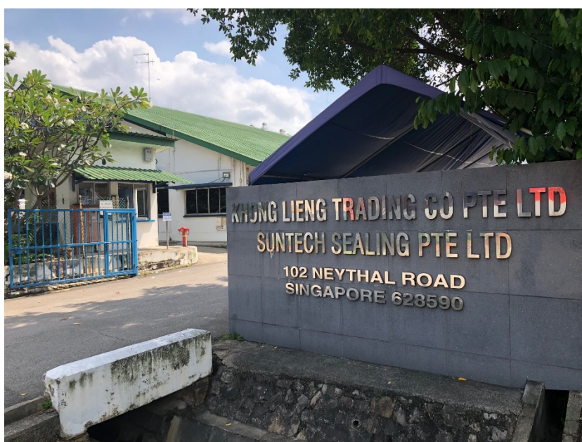
Khong Lieng Trading Company Pte Ltdの外観

KLTグループは、ガスケット製品（パイプや配管の継ぎ目に使用し、内容物の漏れや異物混入を防ぐための固定用シール）を輸入し、シンガポールを中心とした東南アジア各国の製油所、工場、船舶などに加工販売しております。