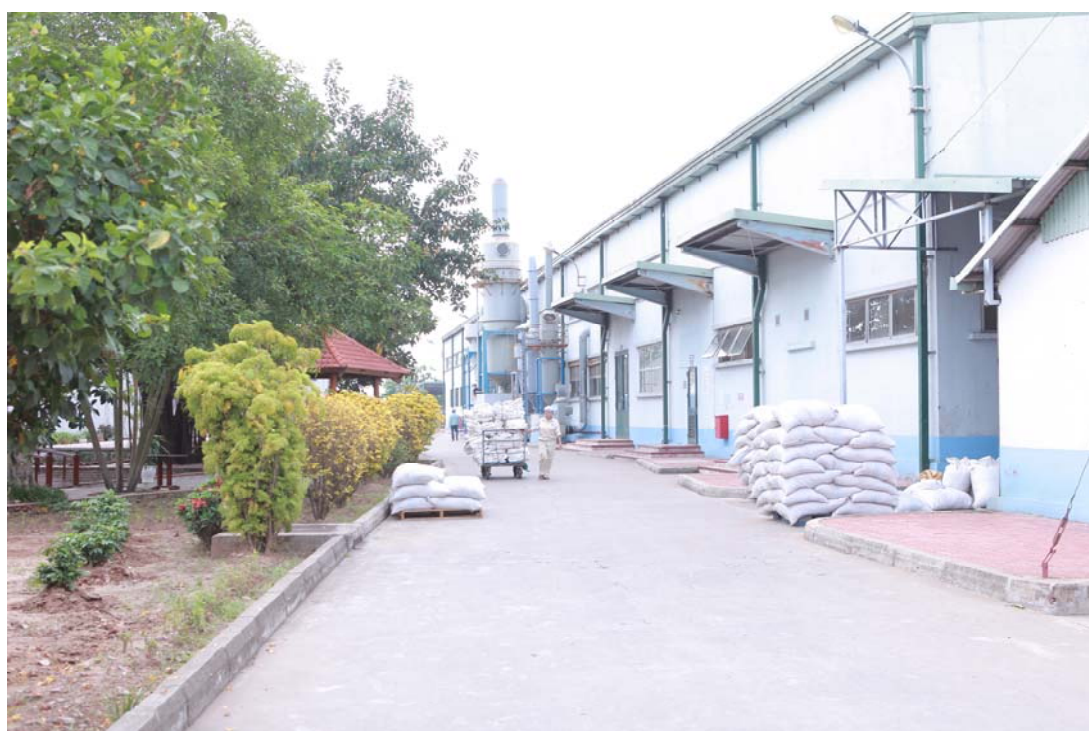
(写真はベトナムにある Son Ha 社の工場であります)

ベトナムは世界最大のコショウ生産・輸出国であり、また、ベトナム産のシナモンは良質であります。PBP 社は、主に欧米に輸出しております。