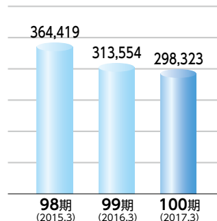
■売上高 (単位:百万円) 通期