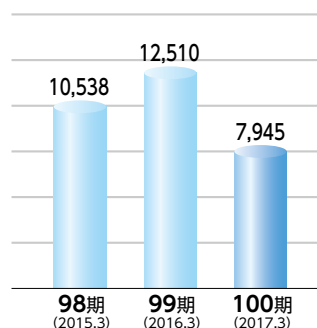
■純利益 (単位:百万円) 通期