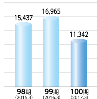
■経常利益 (単位:百万円) 通期